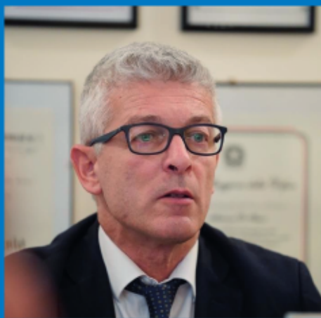
GAETANO SAFFI OTI