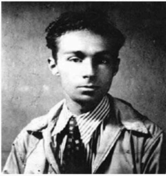
Primo Levi 1919-1987